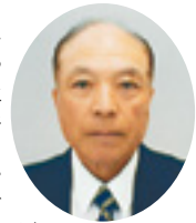
阿波市社会福祉協議会