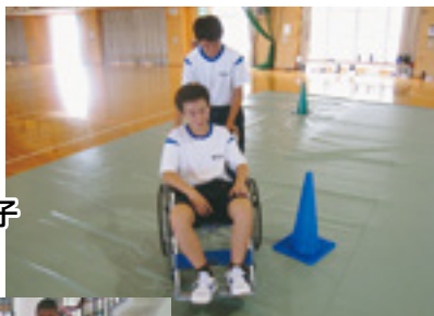
阿波中学校2年生 福祉体験授業の様子