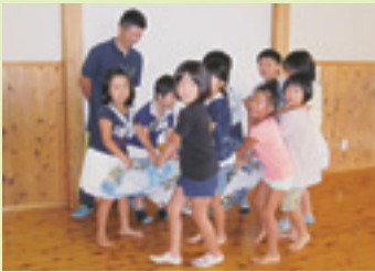
毛布で担架づくり