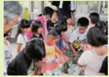
ハイゼックスで炊飯

8月29日(土)市場児童センターにおいて、市場町八幡地区の民生児童委員さん、市場地区地域福祉活動計画実行委員さん、阿波西高校のボランティアの皆さんに協力していただき、阿波市児童館合同防災デイキャンプを開催しました。